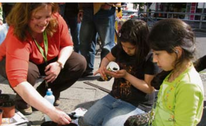
Für viele Kinder eine neue Erfahrung: Pflanzen.