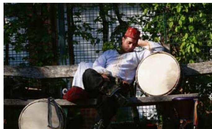
Impressionen vom sonnigen und heiteren Fest.