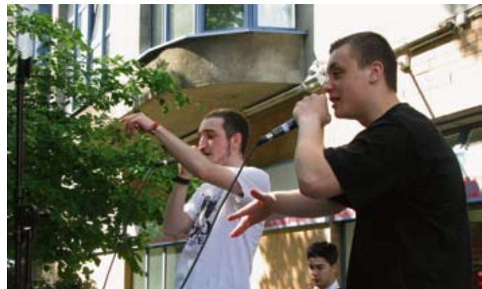
Die Hip-Hop-Fabrik auf der Straßenbühne.