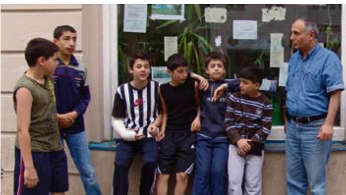
Der Treff 62 ist ein wichtiger Anlaufpunkt für die Kids.

Kontakt: Treff 62 Katzler Str. 8, 10829 Berlin Tel: 215 324 27 Ansprechpartner: Veysel Saydan