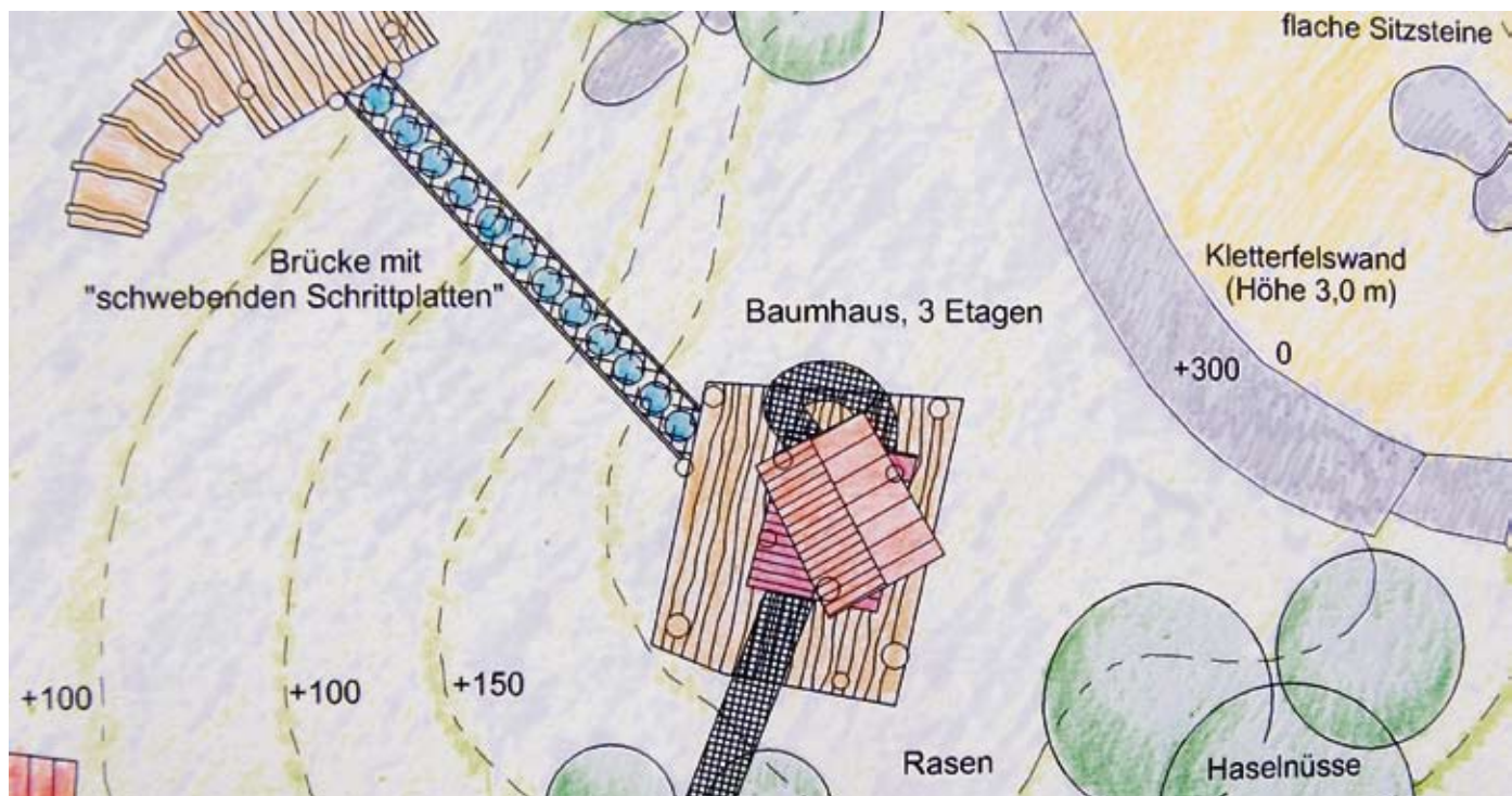
Ausschnitt aus dem Vorentwurf für die Neugestaltung des Spielplatzes im Nelly-Sachs-Park, Büro Reif + Eberhard GbR - Freischaffende Garten- und Landschaftsarchitekten.

Wenn Tom und Mehmet groß sind, wird vermutlich auch der Spielplatz im Nelly-Sachs-Park nicht mehr up-to-date und abgenutzt sein. Ob Tom dann als Landschaftsplaner oder Architekt wohl an der Neugestaltung mitwirken wird?