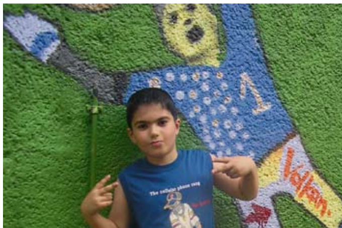
Die gemeinsam gestaltete Wand ist sehr beliebt.

Der Treff 62 organisiert das Fest und möchte, dass alle mitmachen: die Seniorenfreizeitstätte