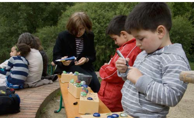
Mit viel Engagement malten die Kleinen.