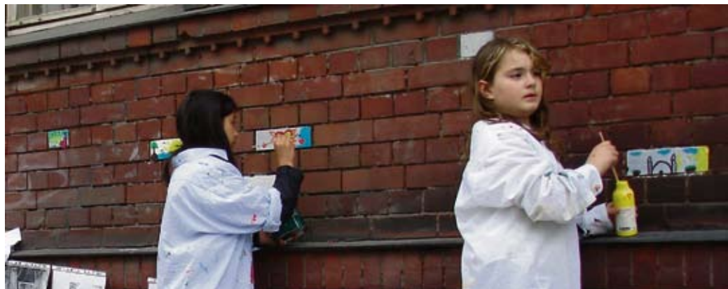
Kinder beim Bemalen der Fassade der Elisabeth-Klinik.