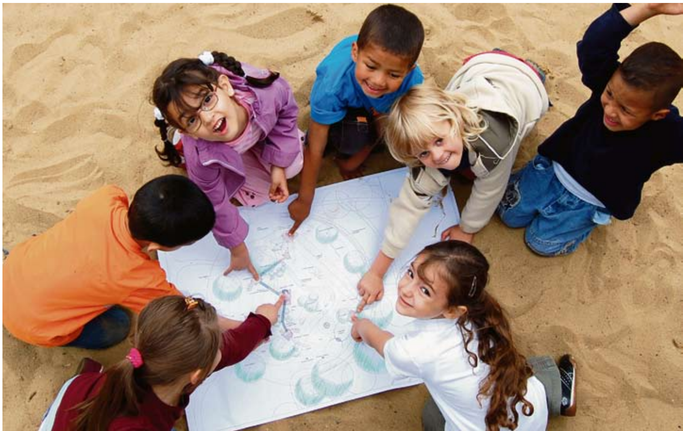
Die Kinder der Kita Bülowstraße freuen sich schon auf den neuen Spielplatz.

Baumhäuser, Seilbahn und Dschungelbrücken bringen neues Leben auf den Spielplatz