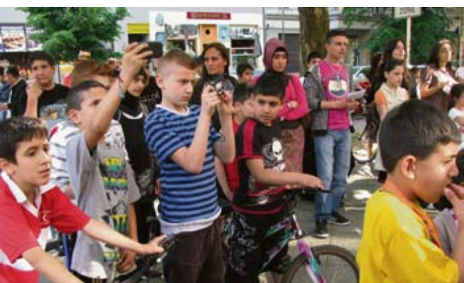
Fasziniertes Hip-Hop Publikum.