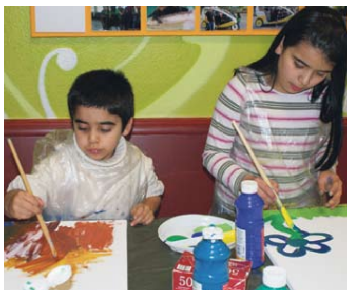
Die eigenen Fähigkeiten entdecken lernen.

Anfang nächsten Jahres werden die Werke in einer Ausstellung präsentiert. „Die Kinder fühlen sich wie die