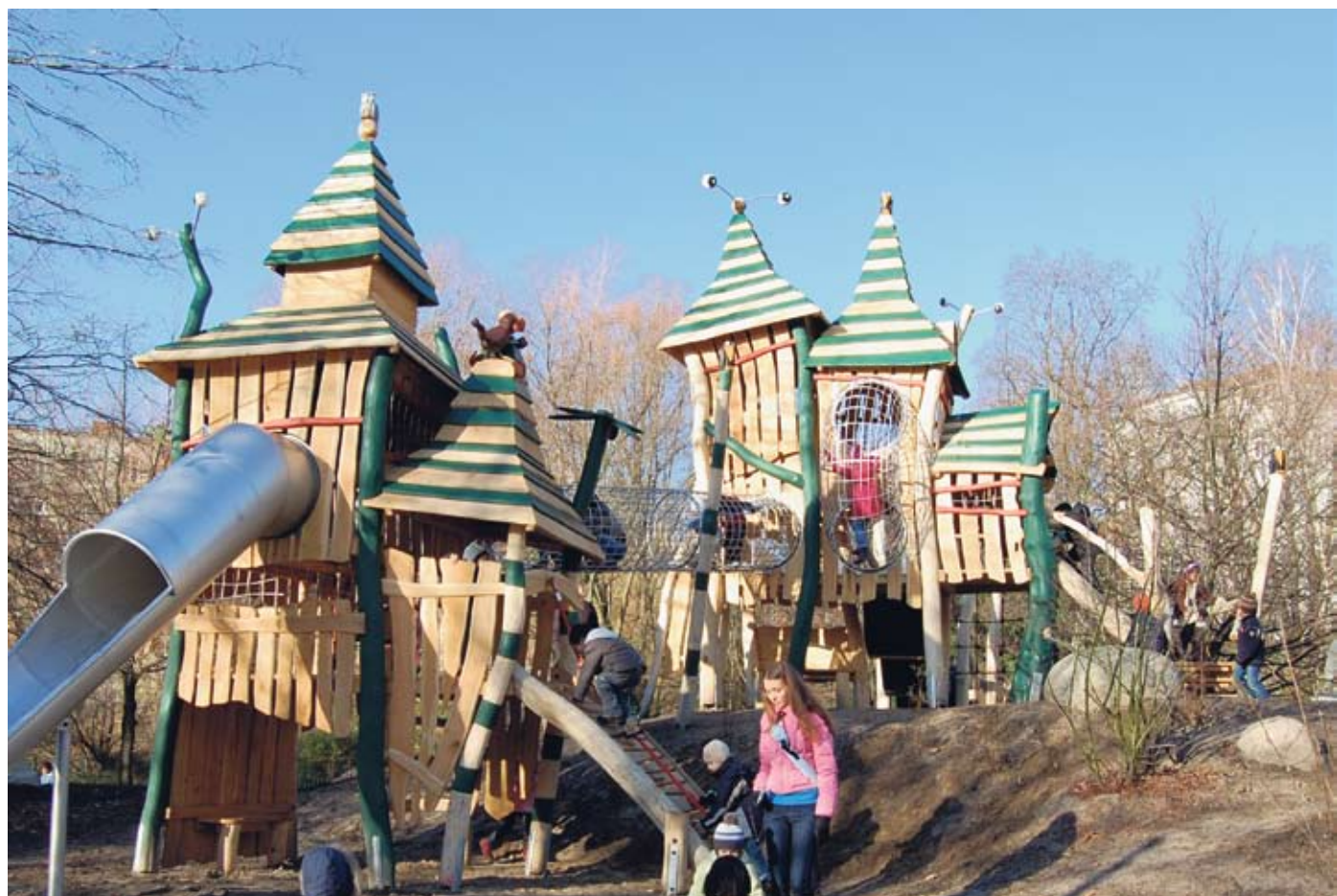
Ein lebendiger und phantasievoller Spielplatz ist im Nelly-Sachs-Park entstanden - Kinder und Eltern freuen sich!

Auch Anwohnerin Mila Hacke ist begeistert. Und auch ein wenig stolz. Denn Sie hatte die Idee zur Neugestaltung erst im Frühjahr 2008 bei einem Ideen-Aufruf des Teams QM eingereicht. Und dass der neue Spielplatz bereits Ende November 2009 eröffnet werden konnte, hätte sie selbst nicht für möglich gehalten. Bürger-Engagement lohnt sich!