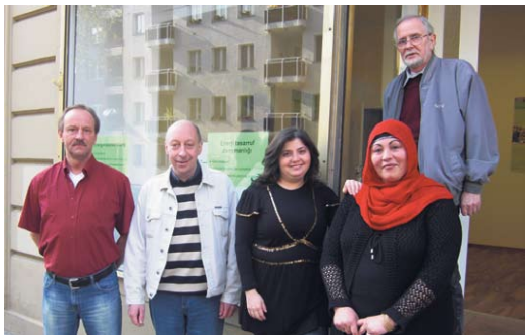
Das Energiesparberater-Team steht Energiesparwilligen mit Rat und Tat zur Seite.

Energiesparberatung Nachbarschaftsheim Schöneberg e.V. Alvenslebenstraße 3, 10783 Berlin Tel.: 21 01 89 62 /-76 Mo., Mi. und Fr. 9 - 13 Uhr, Di. und Do. 14 - 18 Uhr