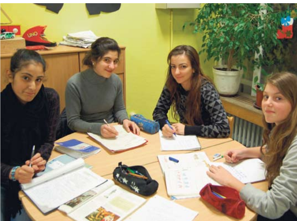
Gemeinsam lernt es sich besser und macht sogar Spaß - besonders wenn es noch gute Tipps gibt.