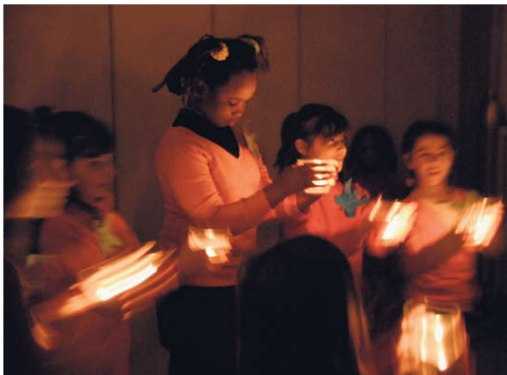
Licht für ein friedliches Miteinander von verschiedenen Kulturen und Religionen.

Die Vertreter der Semerkand Moschee in der Kurfürstenstraße