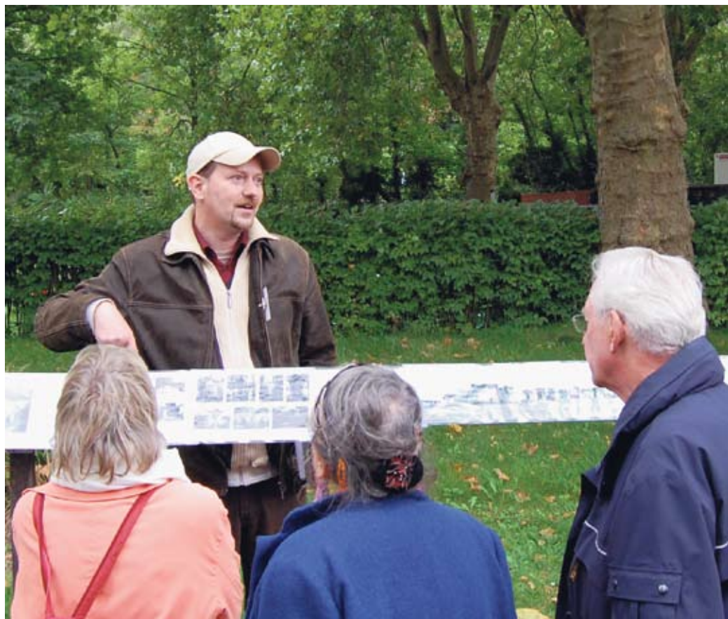
Führungen auf dem Alten Friedhof der St. Matthäus Gemeinde sind sehr beliebt.