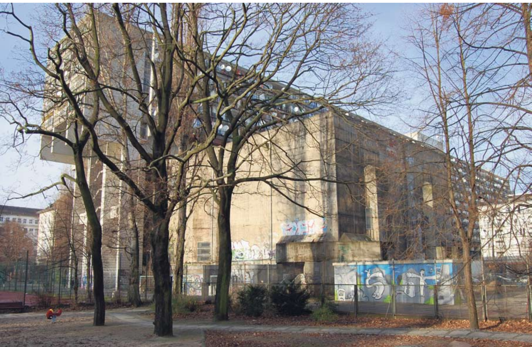
Der Hochbunker in der Pallasstraße wurde mit dem Pallasseum überbaut. Ganz unsichtbar ist er dadurch nicht geworden, wie diese Aufnahme vom Kleistpark aus zeigt.

Nächste Ausgabe: Das Kammergericht am Kleistpark