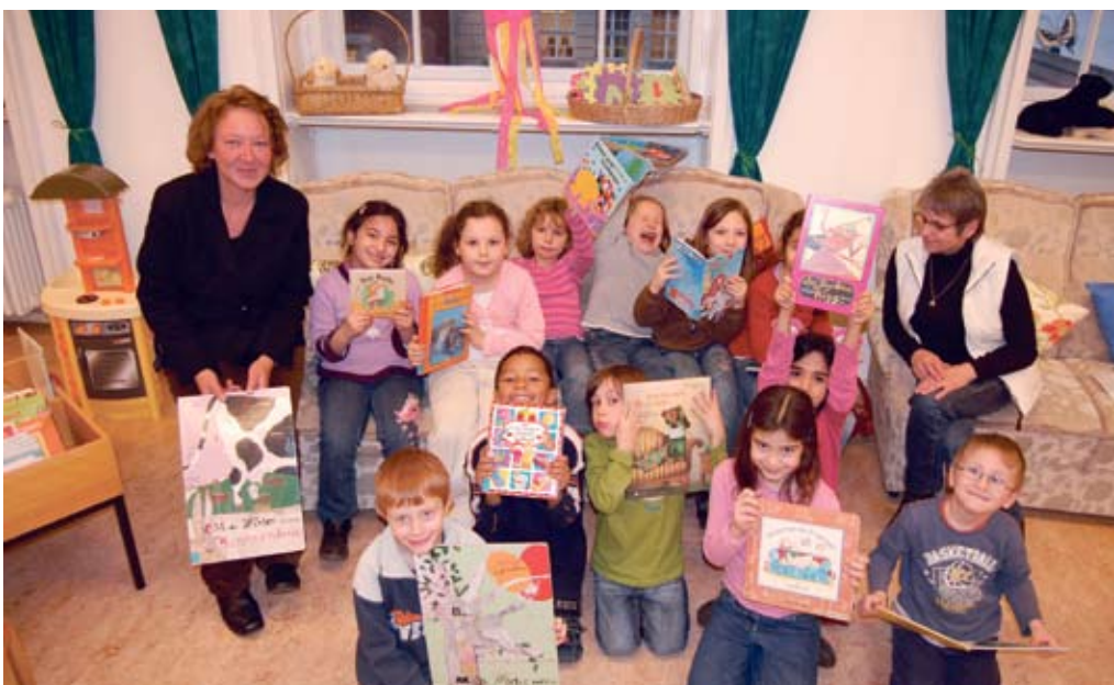
Heute ist die Stadtteilbibliothek ein wichtiger Partner für die Schulen und Kindergärten.