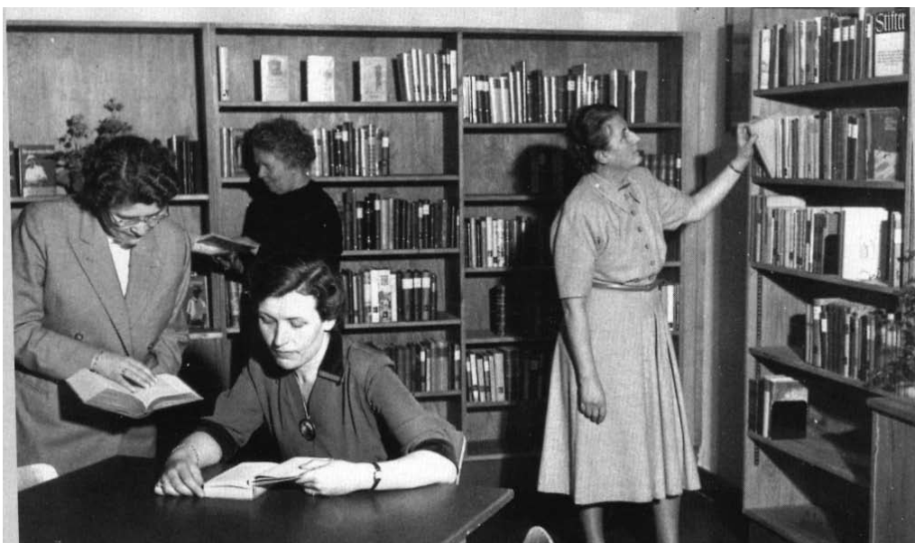
Die Mitarbeiterinnen der "Zweigstelle Nord" 1954.