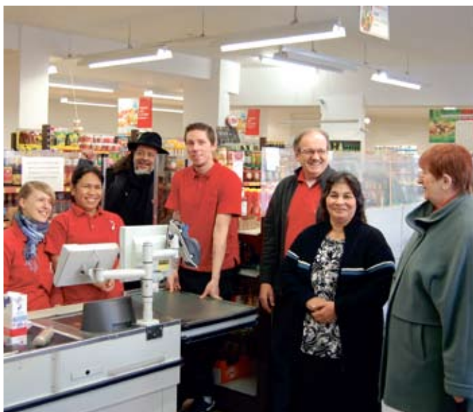
Freundlichkeit und gute Laune gibt es hier gratis.