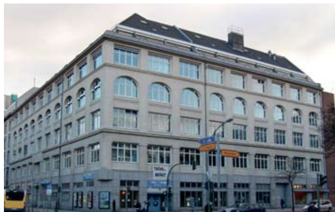
Der PallasT Ecke Potsdamer Straße.

Allen Anfang ist schwer sagt das Sprichwort. Doch für den Neubeginn des Stadtteilvereins Schöneberg im PallasT traf das nicht zu. Zahlreiche Kinder haben seit Anfang des Jahres die Angebote begeistert aufgenommen.