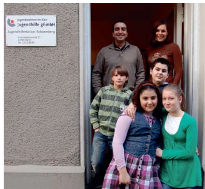
Nur Hand in Hand können alle gewinnen.

Im Schöneberger Norden ziehen für die Verbesserung der Bildungschancen der jungen Kiezbewohner Kitas, Familienbegegnungsstätten, Schulen und Freizeiteinrichtungen nicht nur im Bildungsnetzwerk an einem Strang. Im vergangenen Jahr wurden viele Projekte für die nächste Zeit auf den Weg gebracht. Im VorOrtBüro des Quartiersmanagements können sich Eltern, Kinder und Jugendliche gern darüber informieren, was in der nächsten Zeit in Sachen Bildung im Stadtteil läuft.