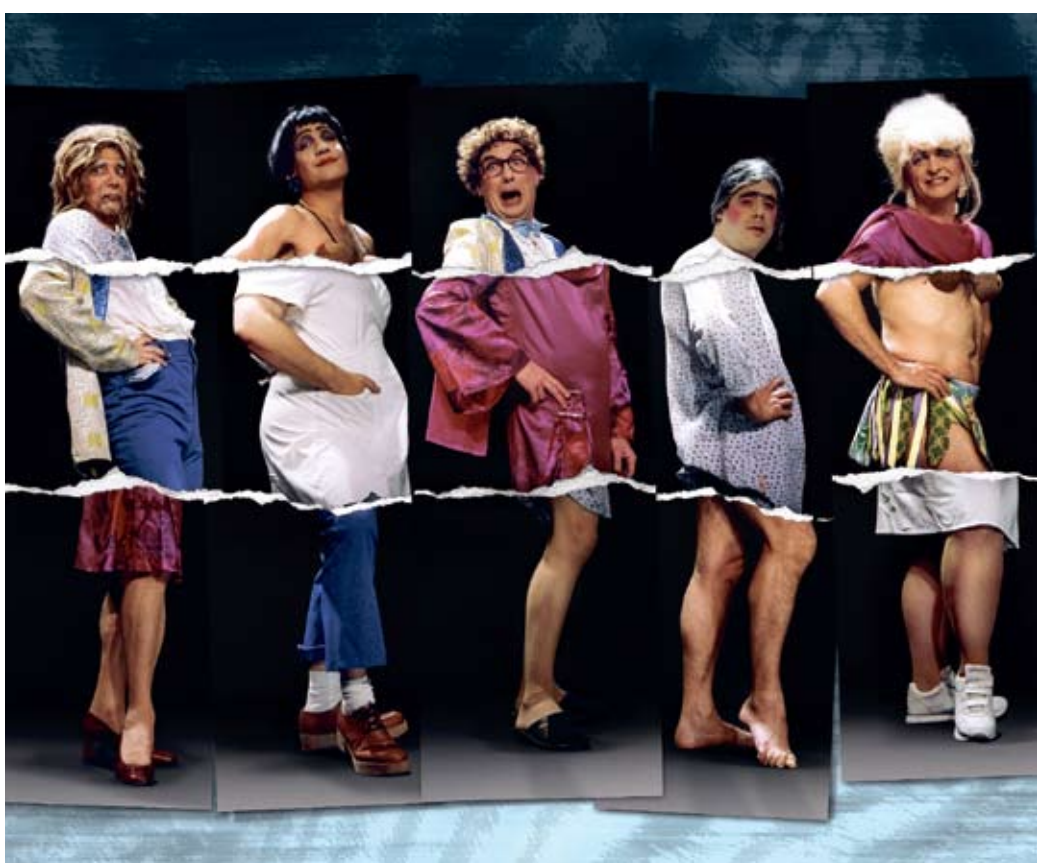
Die O-Ton-Piraten "Geschnitten vom Stück".