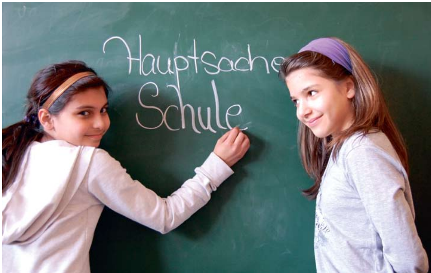
Kinder sind neugierig und wollen lernen - dabei sollte man sie mit allen Mitteln unterstützen.

Viele Angebote im Schöneberger Norden unterstützen Kinder, Jugendliche und deren Eltern