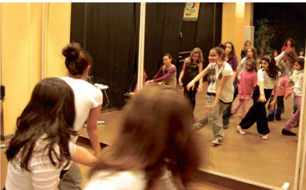
Spieglein Spieglein an der Wand: HipHop für Mädchen im PallasT.

PallasT Ali Agace (allgemeine Koordination) Hilmar Röhner (Koordination Angebote – täglich 16.00 - 20.00 Uhr Vor-Ort) Pallasstr. 35 10781 Berlin Tel: 90277-7896 und 90277-7856