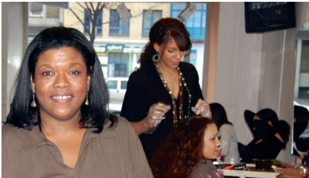
EBONY & IVORY und Best-Market prägen mit anderen Geschäften das Gesicht des Kiezes.