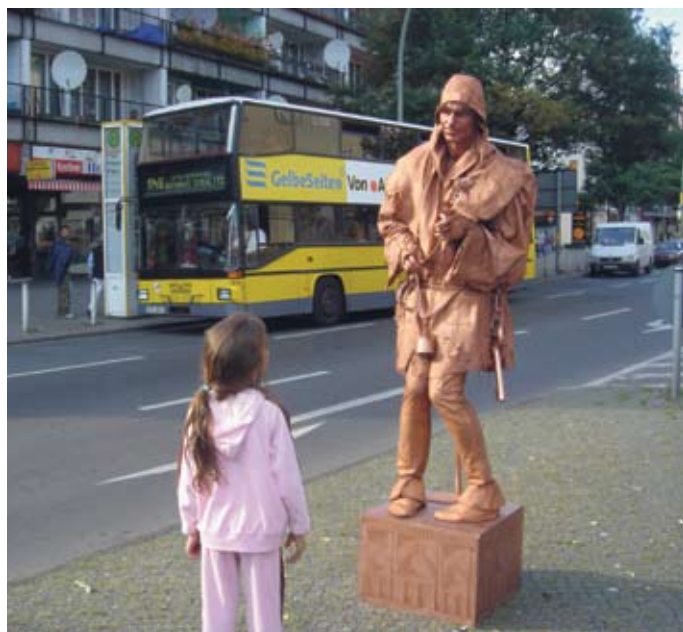
Lebendig und überraschend - die Potsdamer Straße.

Bei allen Veranstaltungen ist die Broschüre erhält-