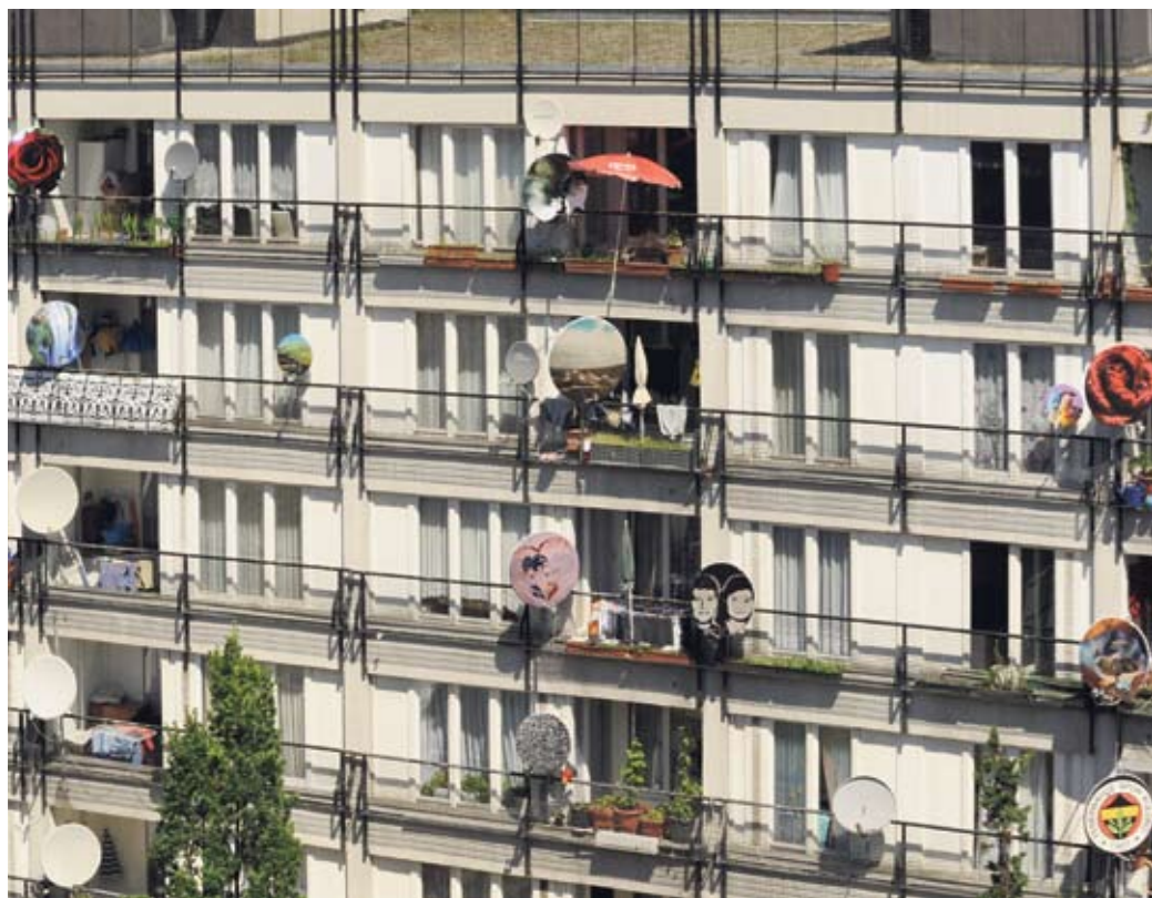
Die Bewohner/innen des Pallasseums senden via "Satellite" von innen nach außen.