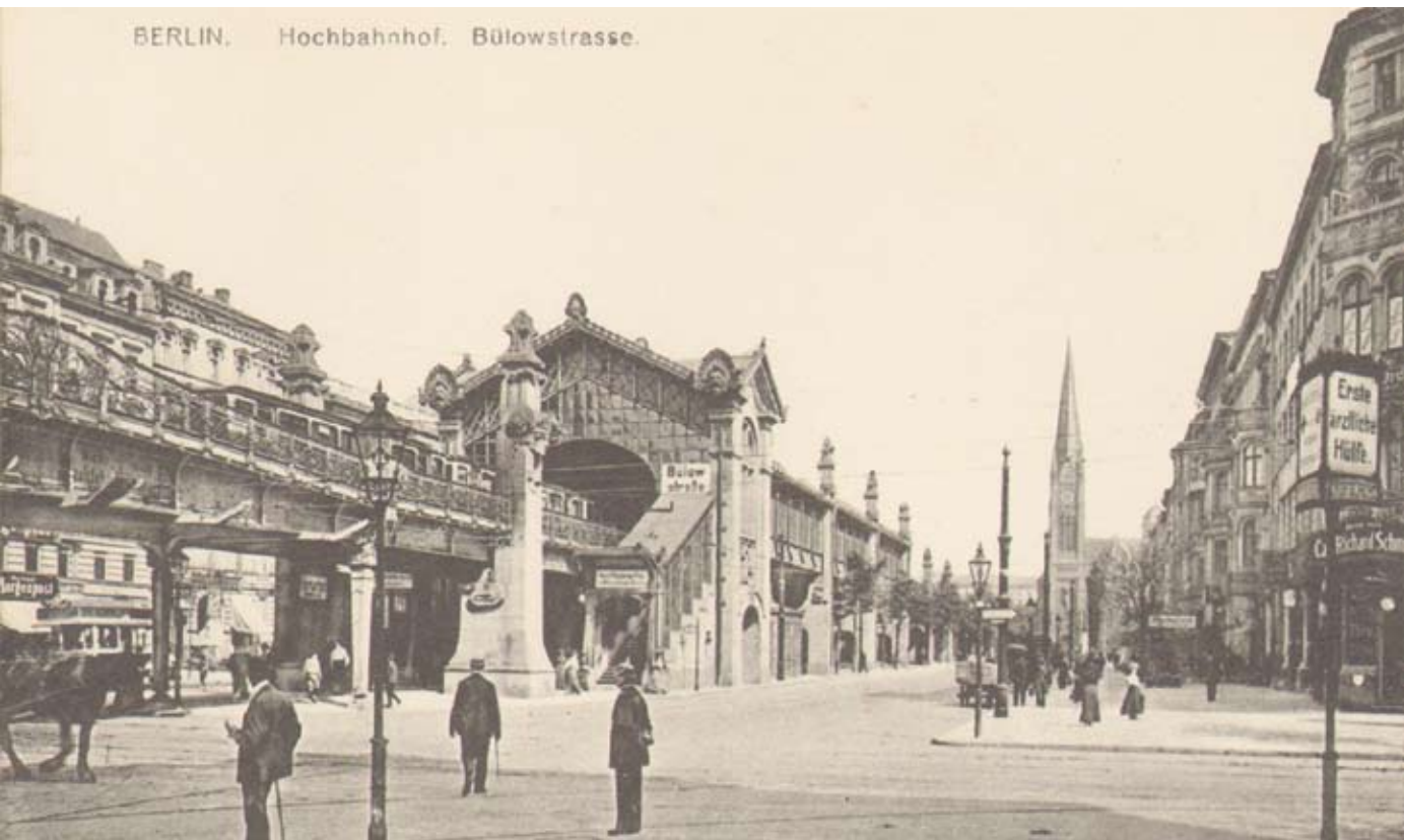
Der Bahnhof Bülowstraße vor ca. 100 Jahren - noch nicht umtost vom Autoverkehr.