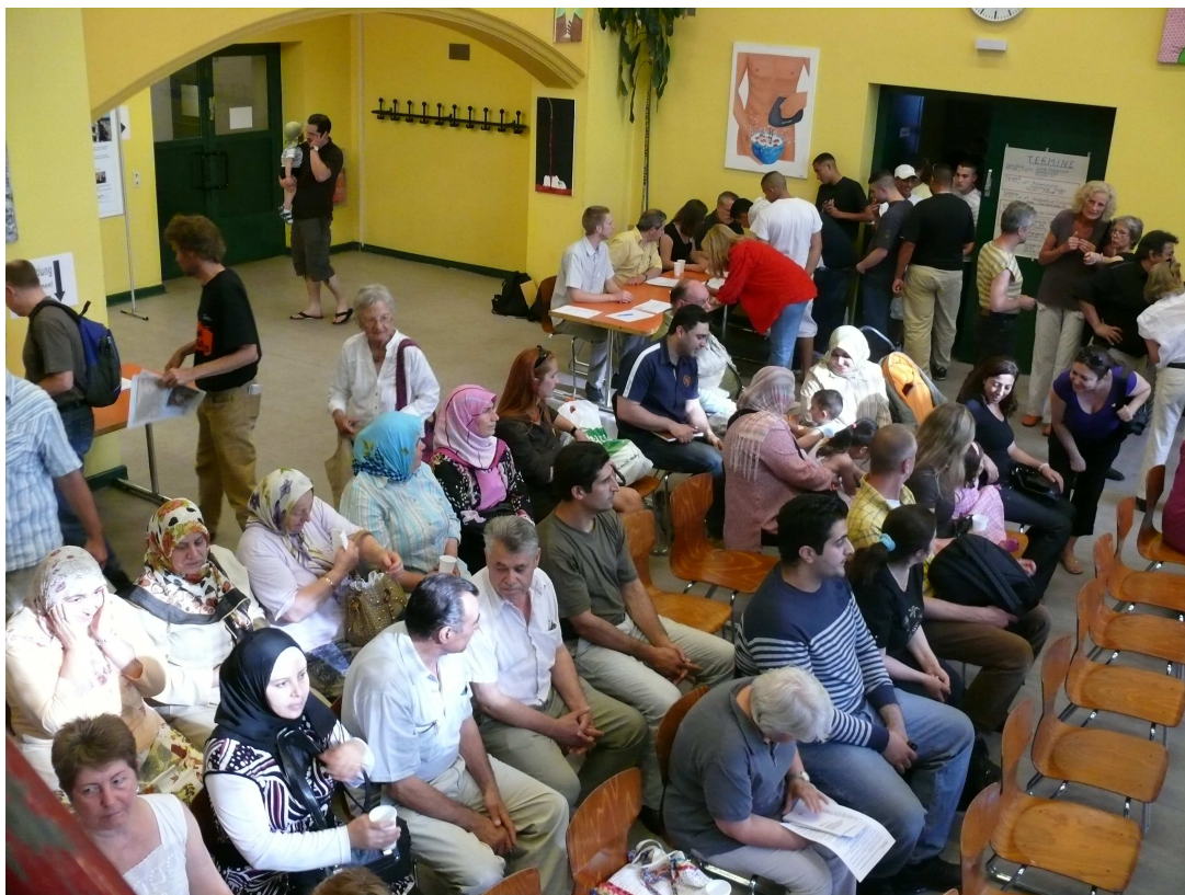
Neuwahl des Quartiersrates 2008

Team Quartiersmanagement Schöneberger Norden (Gebiet „Bülowstraße/Wohnen am Kleistpark“)