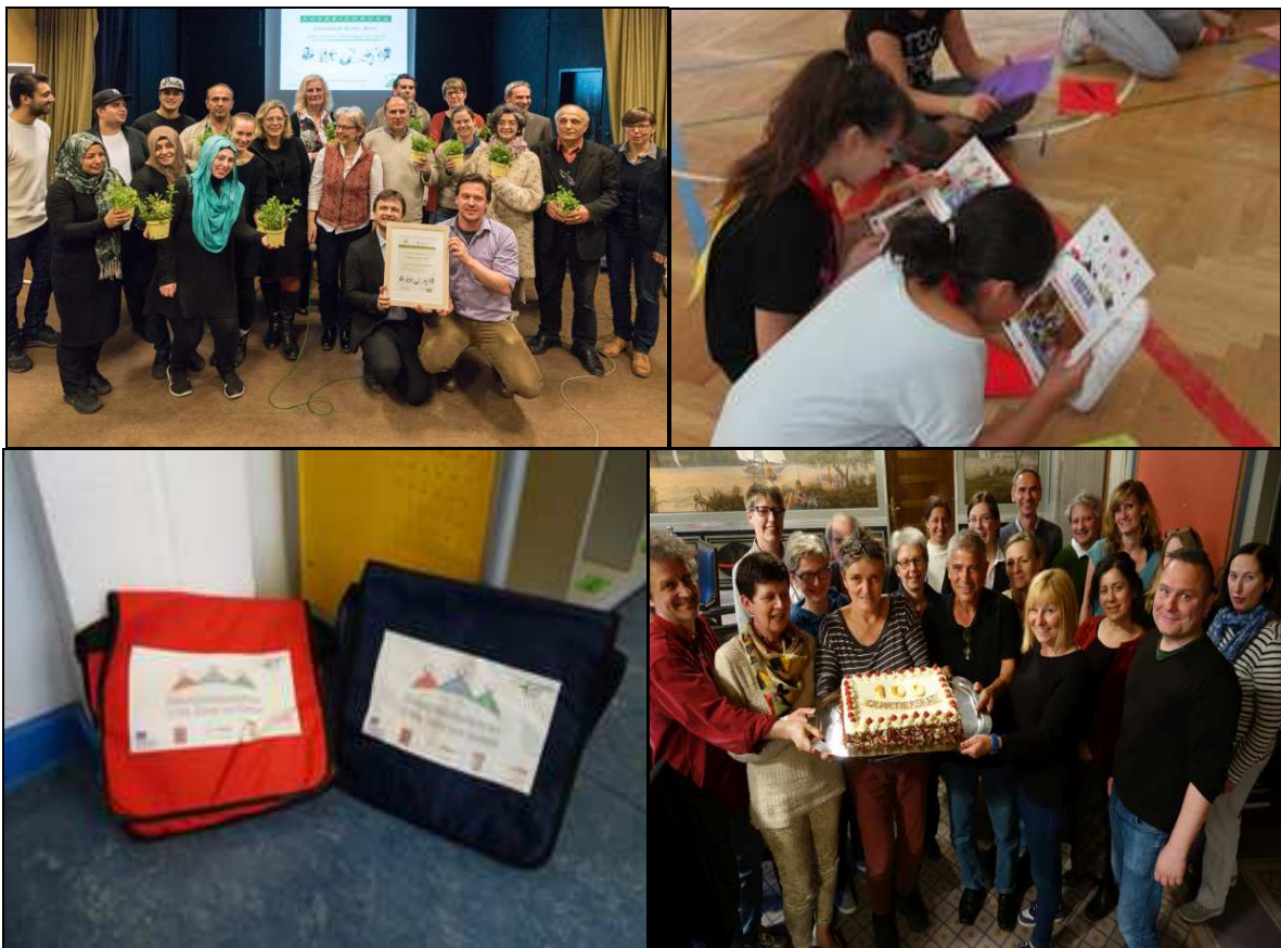
Grünes Modellquartier Schöneberger Norden – Mädchenfußball – Bildungsbotschafter/innen - 100. Sitzung des Quartiersrates

Team Quartiersmanagement Schöneberger Norden